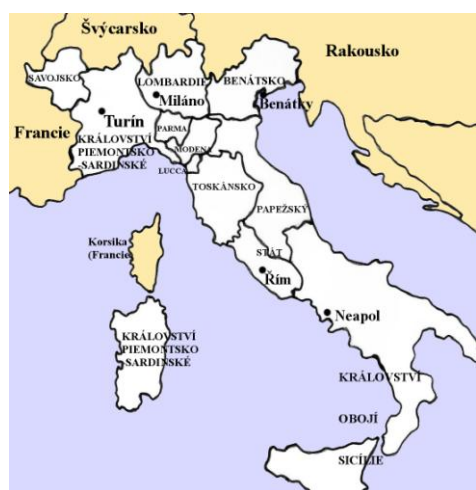
Piemontsko-sardinské království roku 1815

ÚLOHA 16: Na mapách vybarvěte státy, které tvořily Itálii v jednotlivých etapách sjednocení: