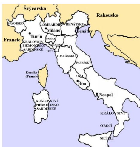
Území sjednocená v letech 1859-1869