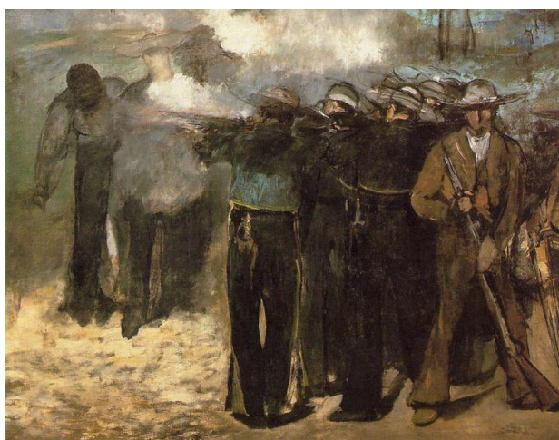
Maxmiliánova poprava, namaloval Edouard Manet