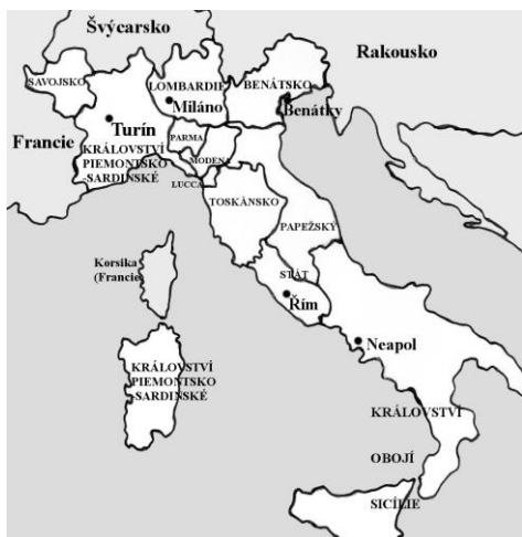
Piemontsko-sardinské království roku 1815

ÚLOHA 16: Na mapách vybarvěte státy, které tvořily Itálii v jednotlivých etapách sjednocení: