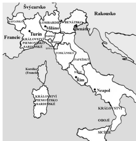
Území sjednocená v letech 1859-1869