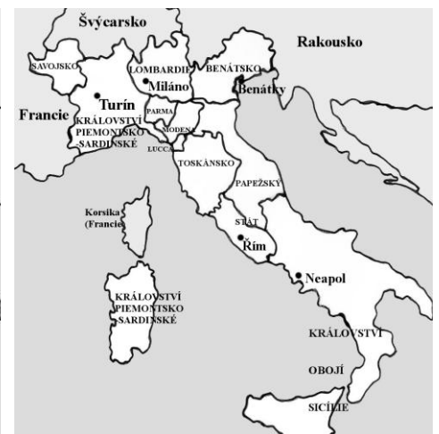
Území sjednocená v letech 1870-1871