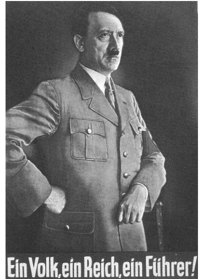
Nacistický plakát z roku 1930. Řiká: „Jeden národ, jedna říše, jeden vůdce!“