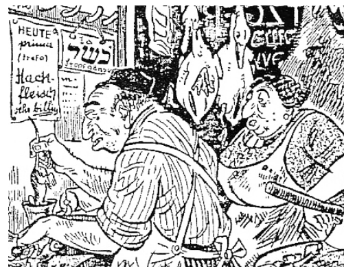
Karikatura Židů v nacistických novinách, 1935.